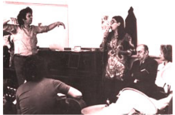
Mikis Theodorakis (links), Maria Farantouri (Mitte) und Pablo Neruda (rechts sitzend) bei Proben zu Canto General in Paris 1972

Weitere Aufführungen gemeinsam mit anderen internationalen Chören sind vorgesehen bei den Olympischen Spielen 2004 in Athen und in Israel/Palästina, unter der Leitung von Mikis Theodorakis.